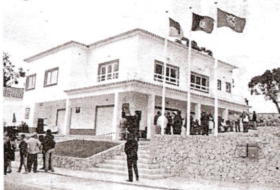
Edifício com múltiplas valências

2001, pela então presidente da Câmara, Edite Estrela, em cujo mandato foi também outorgada pela Câmara a verba de 142.500 euros para a construção, que importou em 300 mil euros, sendo a diferença suportada pela Junta de Freguesia de S. Martinho. O edifício ocupa uma área de 350 metros quadrados, repartidos por dois pisos – rés-do-chão e primeiro andar, exis-